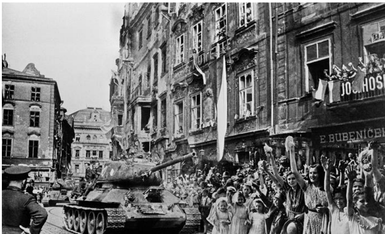
Советских победителей встречают на улицах европейских городов, весна 1945 г.

Как здесь не вспомнить одного из лидеров анти-гитлеровской коалиции, генерала Дуайта Эйзенхауера (руководившего англо-американскими силами при высадке войск в Нормандии 6 июня 1944 года), откровенно писавшего в своих мемуарах, что «великие подвиги Красной армии во время войны в Европе вызвали восхищение всего мира» 45 . Как солдат, наблюдавший кампанию Красной армии, этот крупный военный деятель проникся глубочайшим восхищением мастерством советского руководства.