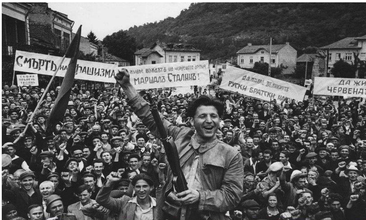
Болгария встречает советских солдат-победителей, сентябрь 1944 г.

«Откуда же берутся суждения, что немецкие генералы были образованнее, благороднее наших, что они более умело и эффективно воевали, а наши полководцы и командиры были будто бы бездарными?», – задается вопросом М.А. Гареев. Советские полководцы к началу войны были, как правило, в возрасте 40 – 45 лет и до 50. Фельдмаршалы – элита Германии были старше. Имея за своей спиной многовековые традиции прусского милитаризма, внушавшие почтение, уважение и страх. После победы над Польшей и Францией вокруг них и в целом германской армии создавался ореол непобедимости. Но этот миф непобедимости был сокрушен уже осенью 1941 года под Москвой, когда свыше 30 фельдмаршалов, генералов и высших офицеров были отстранены от должностей.