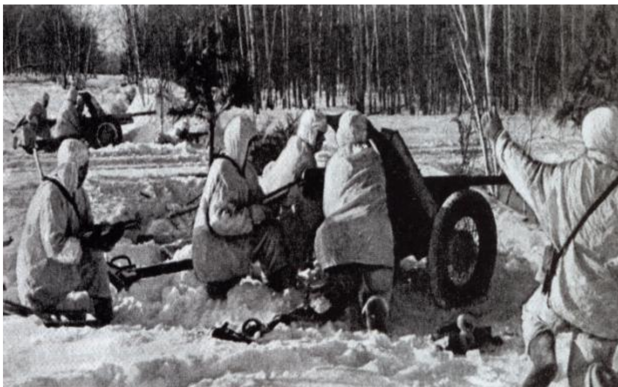
На позициях под Москвой 1941 г

В.В. Путиным было отмечено, что Махмут Ахметович «достойный представитель прославленного поколения победителей, волевой, энергичный человек и настоящий патриот. Он мужественно прошёл фронтовыми дорогами Великой Отечественной, а после войны посвятил себя развитию Вооруженных сил, укреплению обороноспособности и национальной безопасности страны». Подчеркивалось, что «знания, опыт, преданность делу Махмута Гареева неизменно были востребованы на сложных и ответственных направлениях работы, что он с честью исполнял свой служебный долг, являлся примером для коллег и подчиненных и до последнего дня принимал активное участие в значимой общественной деятельности, в ветеранском движении».