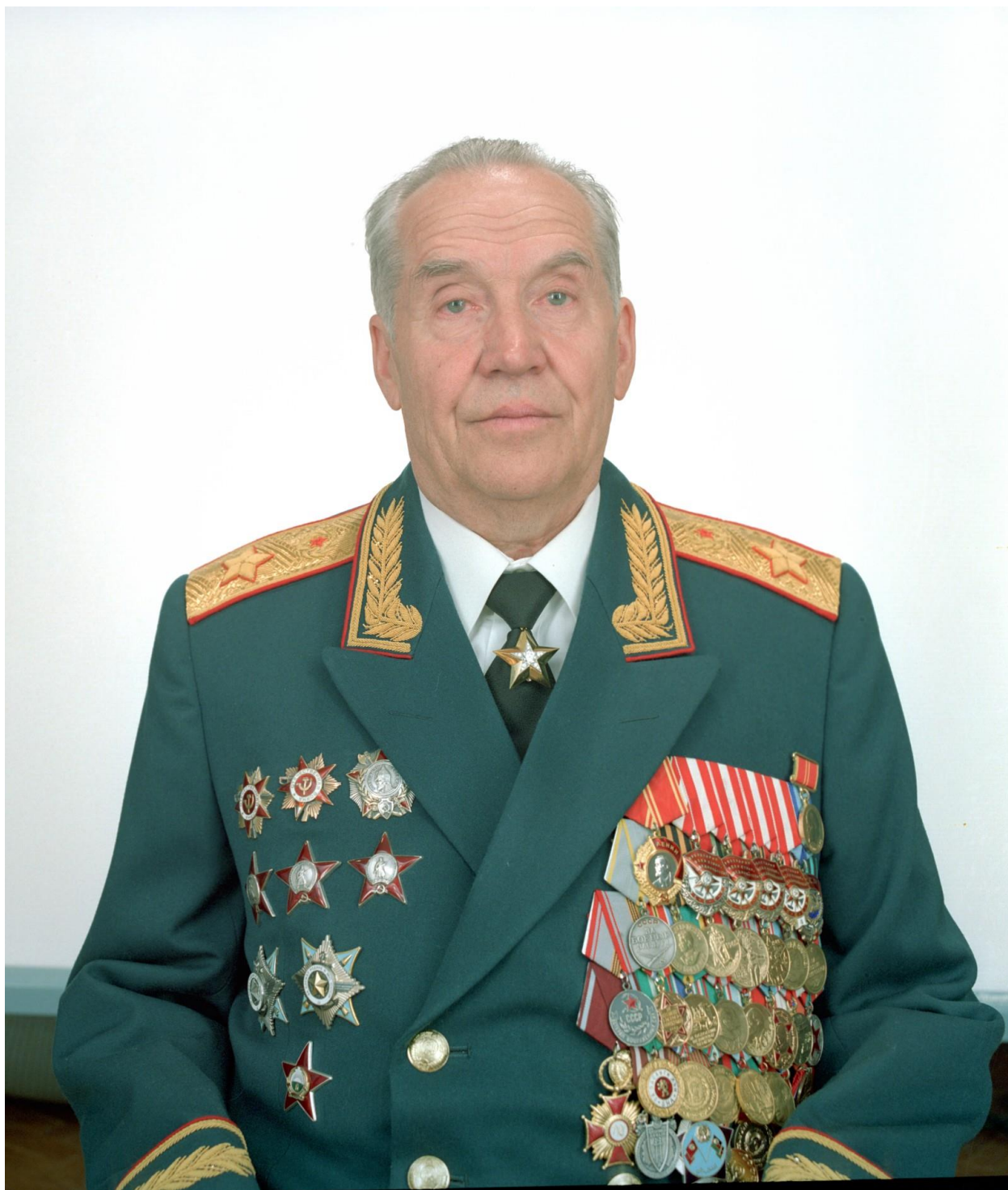
Махмут Ахметович Гареев (1923 – 2019) – Президент Академии военных наук Российской Федерации, генерал армии, генеральный инспектор Министерства обороны Российской Федерации, действительный член Академии наук Республики Татарстан, доктор военных наук и доктор исторических наук, профессор