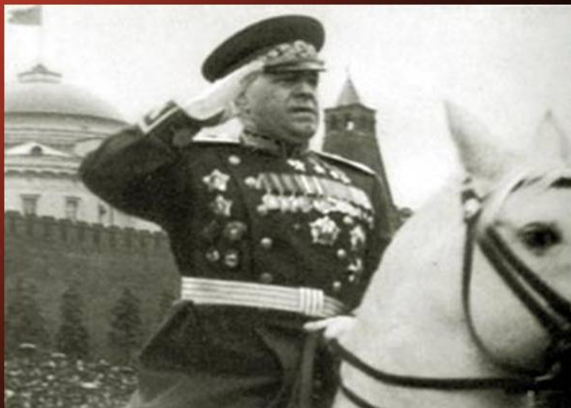
Г.К. Жуков принимает Парад Победы, 26.06.1945 на Красной площади.

11. Маршал, который открыл Парад Победы.