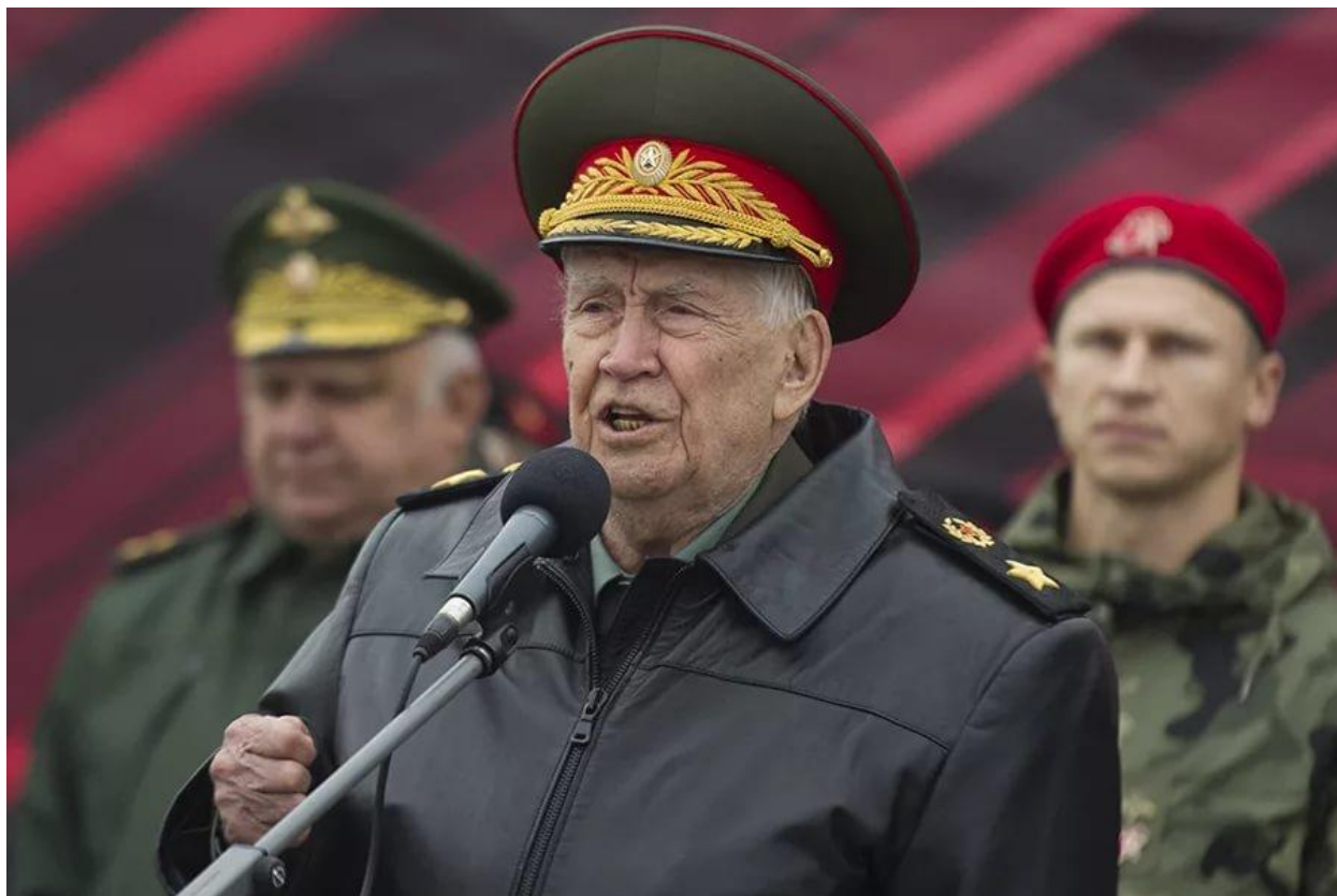
«Мы побеждали вместе и будем побеждать!» Генерал армии М.А. Гареев.

менее 250 – 300 кг! Солдат такого веса не было, а соответственно, слухи возникали из заведомой лжи и некомпетентности.